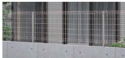
アイボリーホワイト T-8