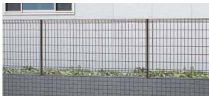
オータムブラウン T-10