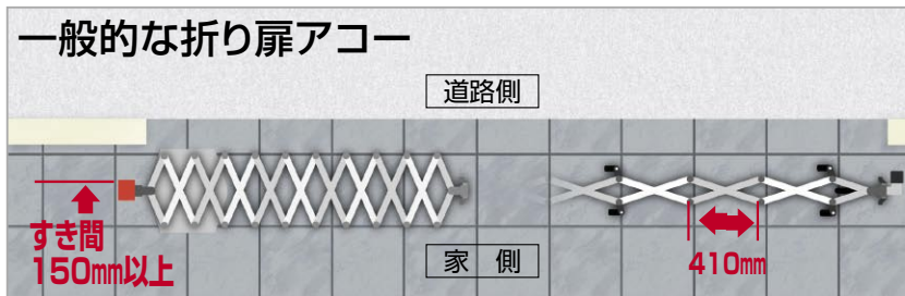
塀と吊元のすき間が大きくパネルピッチも比較的小さい。