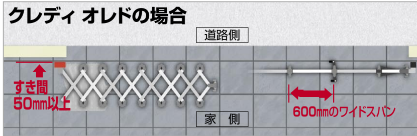
吊元柱の取付位置を変えることで、塀とのすき間が狭く、さらに幅広のパネルピッチを実現。