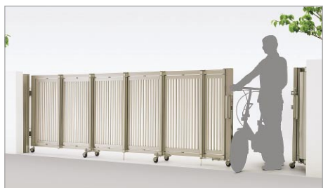
両開き親子タイプ(470Wサイズ)