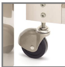
吊元付近にもキャスターを装備。

いままでは調整不足や時間経過により吊元部が保持できなくなり壊れていたが、吊元部にキャスターを取り付けることで、常に安定した開閉が可能になりました。