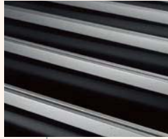
シャープな横線のDY型