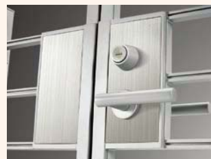
アーキキャストD-style DY型 片開き仕様 シャイングレー デザイン門柱A使用