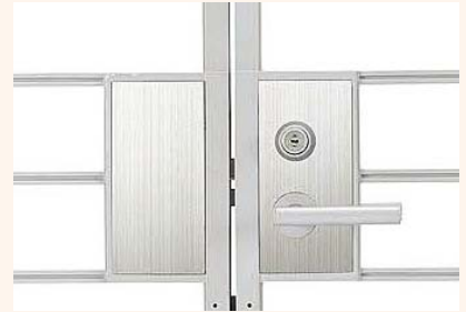
○ナチュラルシルバーF+●ヘアライン