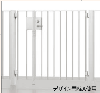
デザイン門柱A使用