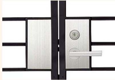
●ブラック+●ヘアライン