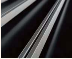
シャープな縦線のDT型

デザインは3種類。定番の直線美がアルミ鋳物の質感によりアーティスティックな印象に。