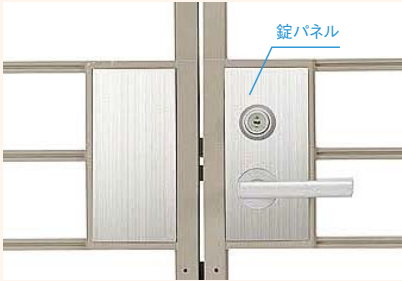
●シャイングレー+●ヘアライン