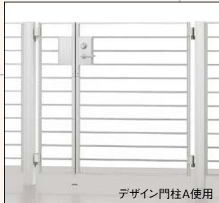
デザイン門柱A使用