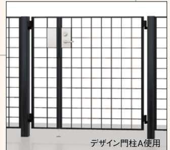
デザイン門柱A使用