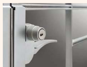
アーキキャストBX型 親子仕様 ブラック 標準門柱使用