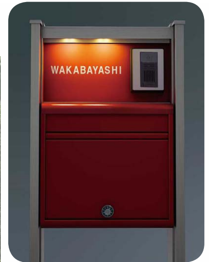
レッド (照明点灯時)