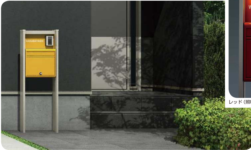
H12 (インターホン加工あり・照明付き・ポストF1型) オレンジ