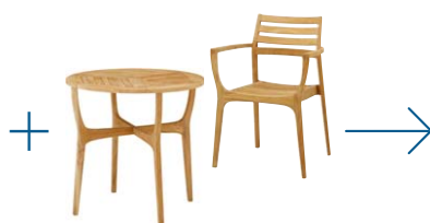
ガーデンファニチャー