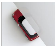
熱線吸収 ポリカーボネート板