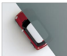
熱線遮断 ポリカーボネート板